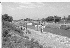
▲岐阜県自然共生工法展示場

●JR岐阜駅または名鉄岐阜駅からバスで約20分(中部国際空港セントレアから名鉄岐阜駅まで車で約60分) 会期中は、JR岐阜駅から会場まで無料シャトルバスを運行します。